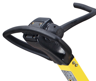
Präzise und sicher bedienbar BOMAG Ein-Hebel-Steuerung